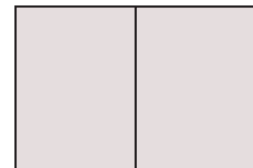
2/2 aukeama 420 x 280 mm

Ilmoitusten hinnat neuvotellaan erikseen.